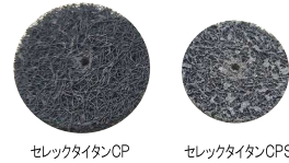
セレクトタイタンCP