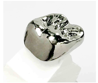
セレクトタイタンCPS